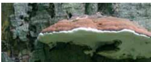
Kernzonen gesichert | Seite 2

Dr. Erwin Pröll Landeshauptmann von Niederösterreich