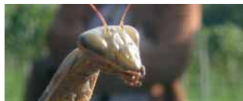
Umweltbildung | Seite 8

Eine Initiative der Länder Niederösterreich und Wien