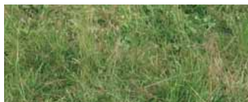
Wiesenmeisterschaft 06 | Seite 5