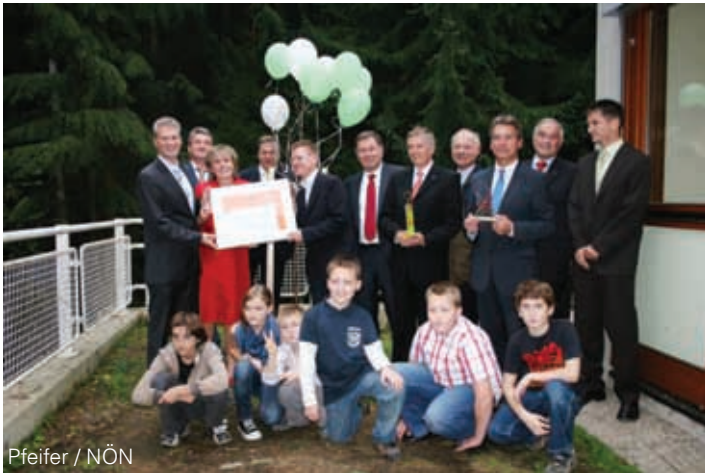
Pfeifer / NÖN

Der Standort Tullnerbach hat für den Biosphärenpark besondere Bedeutung: das künftige Biosphärenpark-Zentrum wird in unmittelbarer Nachbarschaft zum BG Purkersdorf entstehen und soll ein zentraler Ort der Kommunikation und Wissensvermittlung im Biosphärenpark werden.