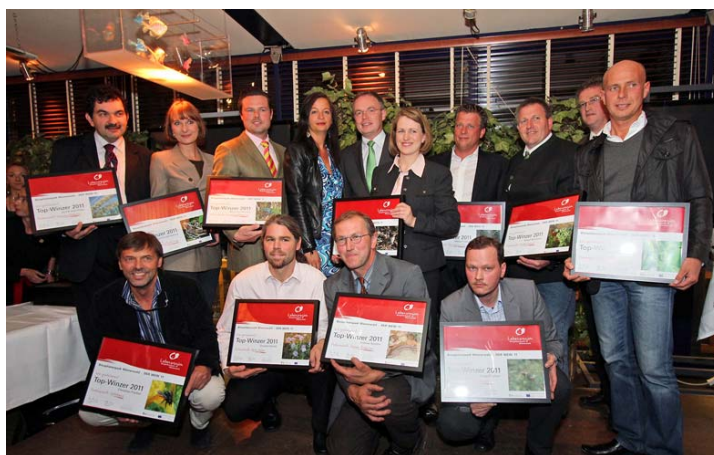
Die TOP-Winzer aus dem Biosphärenpark Wienerwald mit Umweltstadträtin Ulli Sima und Umweltlandesrat Stephan Pernkopf.

Auch diesen Herbst wurden die besten Weine und WinzerInnen aus dem Biosphärenpark Wienerwald prämiert.